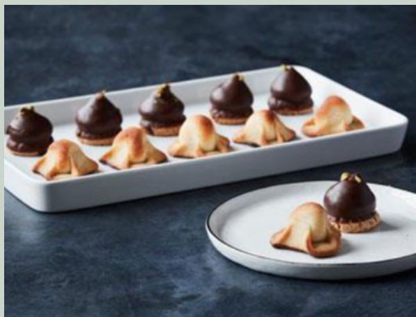
2 petit fours

Kr. 27,- stk. ekskl. moms / 33,75,- stk. inkl. moms